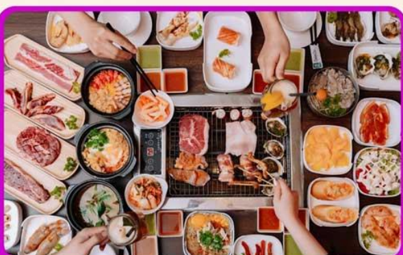
พิเศษ!! เมบูซาซิมิ+บุฟเฟ่ต์ปิ้งย่าง