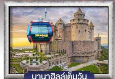
บาน่าฮิลล์เต็มวัน