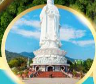
วัดหลิงอิ่ง