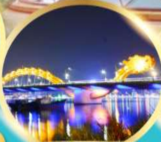
สะพานมังกรพ่นไฟ