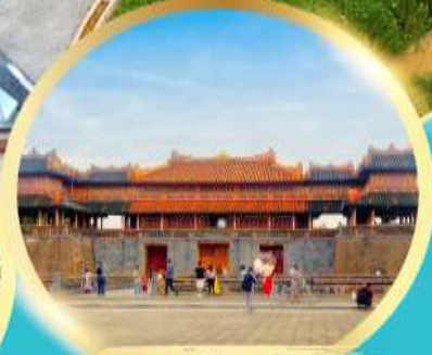
พระราชวังโบราณโคโนย