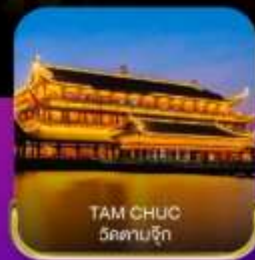
TAM CHUC วัดตามจิก