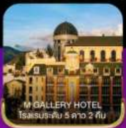
M GALLERY HOTEL โรงแรมระดับ 5 ดาว 2 คืน