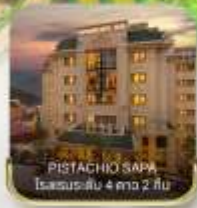
PISTACHIO SAPA โรงแรมระดับ 4 ดาว 2 คืน