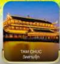
TAM CHUC ร้านอาหาร