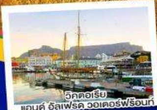
วิกตอเรีย แอนด์ อัลเฟรด วอเตอร์ฟร้อนท์