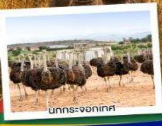
นกกระ-จอกเทศ